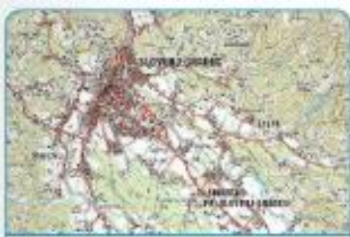
Zemljevid Slovenj Gradca

Skica – risba, ki je narisana na hitro, z najpotrebnejšimi črtami