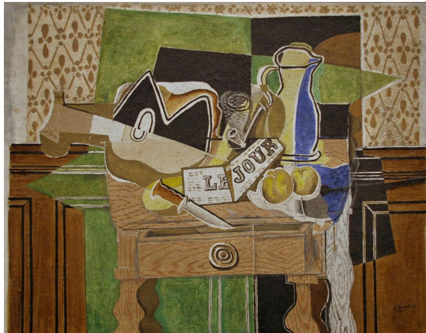
George Braque, Tihostojenje Le Jour, 1929, olje na platnu