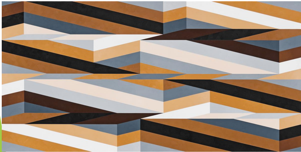
Beti Bricelj, Iz cikla Geo Square, 2012, akril na platnu

Abstrakcija pomeni odmik od realnosti in je nasprotje predmetni umetnosti.