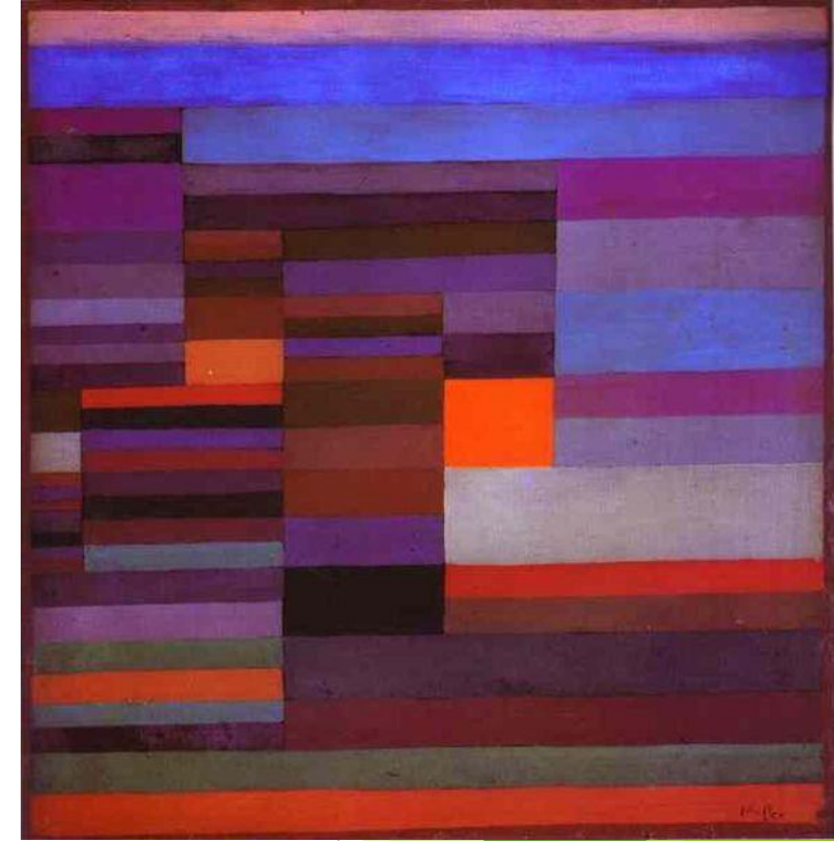
Paul Klee, Večerni ogenj, 1939, olje na lesu