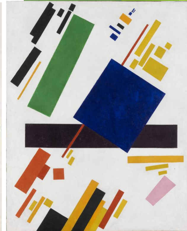
Kazimir Malevič, Suprematistična kompozicija, 1916, olje na platnu

Katere likovne elemente prepoznaš v delih Maleviča in Beti Bricelj?