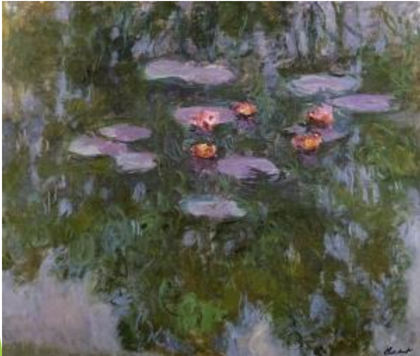
Claude Monet, Lokvanji, 1916, olje na platnu