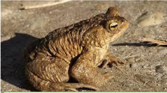
KRASTAČA IZ IZVIRA LJUBLJANICE (VERD)