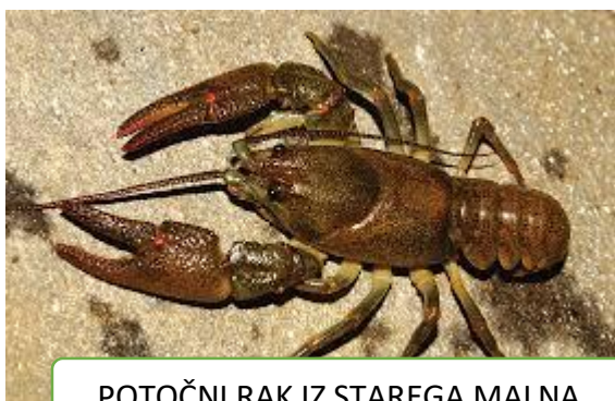
POTOČNI RAK IZ STAREGA MALNA